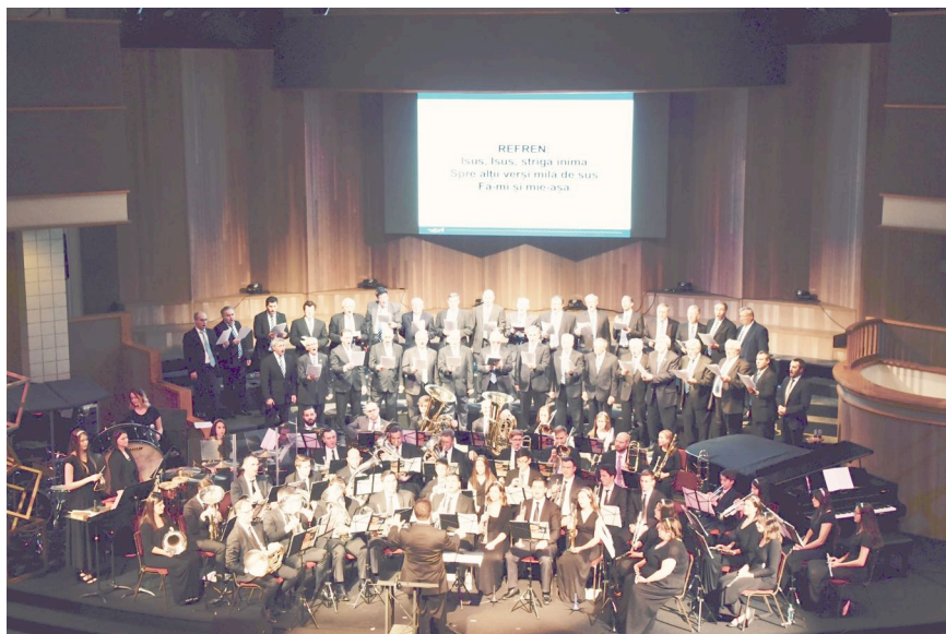
Fanfara „Soli Deo Gloria” împreună cu corul bărbătesc „Laudă Mielului” într-un ansamblu muzical excepțional la Sacramento, California, duminica trecută seara.