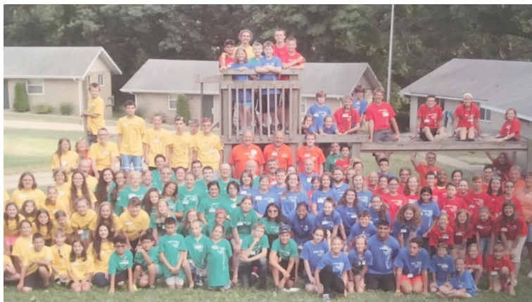
Tabăra AWANA la care au participat și 14 tineri de la noi