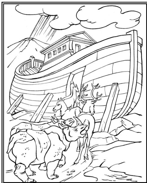
Pentru copii... de colorat

■ Roger Oldham, vorbind la o conferință pastorală baptistă a spus: „S-ar putea să se întâmple chiar aici și chiar copiilor copiilor noștri, să ajungă să simtă ura împotriva credinței în Hristos din partea unei societăți care L-a uitat pe Dumnezeu. Trebuie să ne rugăm ca Dumnezeu să aducă o trezire de proporții masive care să miște încă odată această națiune. Altfel pericolul persecuțiilor e real și aici foarte curând.”