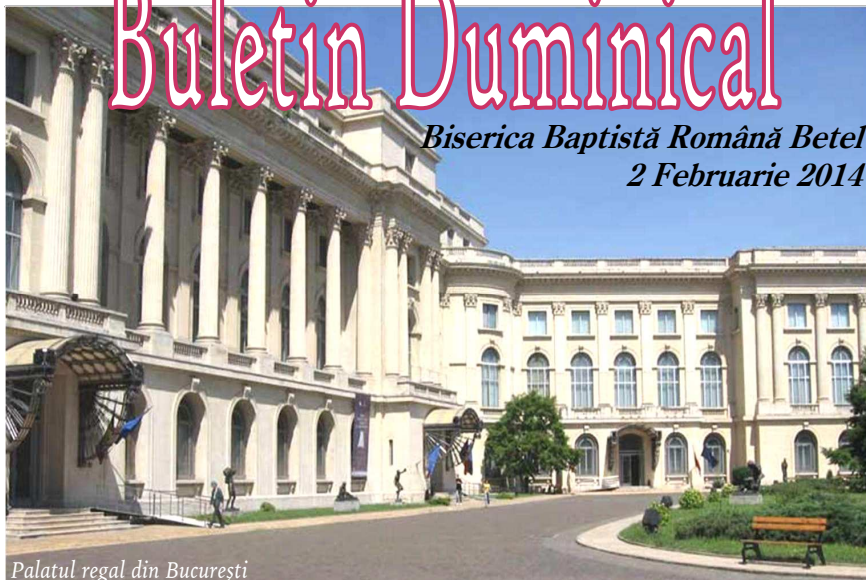
Palatul regal din București

Biserica Baptistă Română Betel 2 Februarie 2014