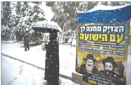
A nins și la Ierusalim (decembrie 2013). Știți că e amintit un caz în Biblie, „când a căzut zăpada”.

Suntem mai buni ca alții, după furtuna rea? După ce-am fost sub pietre, scuipați în zeflema, După ce-am stat cu Domnul în focul suferinței, Suntem noi mai statornici în harul umilinței? ...Mai buni ca altădată, sau suntem tot așa? (V.P.)