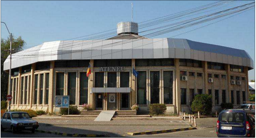
Ateneul din Bacău, unde a cântat fanfara noastră la 25 iunie