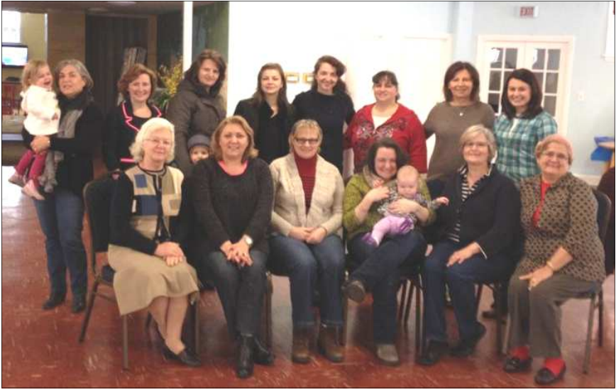
Grupul de surori la studiu biblic, ieri 7 februarie