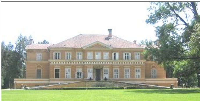
Castelul regal de la Săvârșin, județul Arad

„Mulțămesc lui Dumnezeu, căruia Îi slujesc cu un cuget curat, din moși strămoși, că neînterupt te pomenesc în rugăciunile mele, zi și noapte” (II Timotei 1:3).