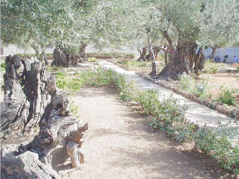
Grădina Ghețimani, în Muntele Măslinilor