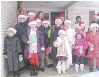
Copiii vor merge cu colinda marți, 22 decembrie, săptămâna viitoare, de la 11:00 dimineața până seara la 7:00.