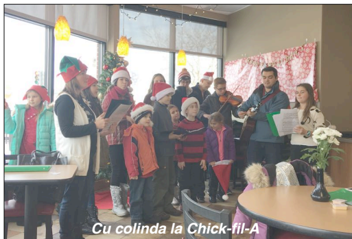
Cu colinda la Chick-fil-A