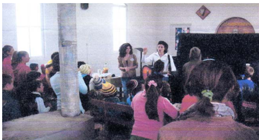
Evanghelizare pentru copii la Săcele

cheltuieli. Dar noi nu avem fonduri rezervă. Dacă unii frați sau biserici vor să-i ajute, să trimită cecul cu specificația: „Misiune Solca”