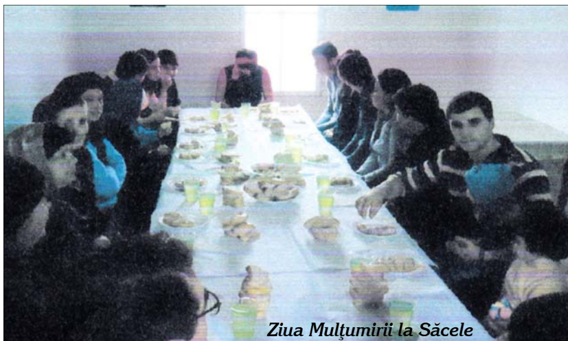
Ziua Mulțumirii la Săcele