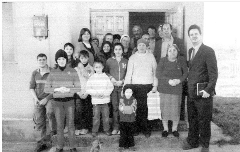
Grup de frați și surori din Săcele, județul Constanța

La Săcele, sat sărac, deși biserica e mică, ei au o lucrare bine dezvoltată cu copii. Au avut evanghelizări speciale pentru copii și Duhul Domnului a lucrat la inimile multora, care sunt deosebit de serioși și sensibili față de lucrarea Domnului. Au surori tinere care se ocupă și îi învață pe copii să cânte laudele Domnului. Unii din ei ajută la pregătirea unor servicii misionare în localitățile învecinate. Biserica dă copiilor săraci o mare atenție. Marea majoritate a copiilor sunt din familii de necredincioși. La studiile biblice cu copiii, ei folosesc un televizor prin care dau seriale din „Cartea Cărților”.