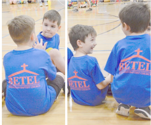
Instantanee: Discuții aprinse între copii...

Spuneți regelui că am cumpărat drumul spre Uganda cu însăși viața mea! (misionarul James Hannington).