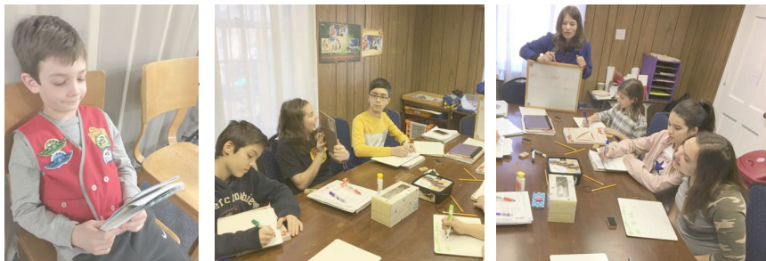
Copiii la activitățile AWANA și la clasele de limba română de sâmbătă

Să-I aducem laudă și cinste. Să-I preamărim Numele în adunarea celor răscumpărați. El este vrednic să primească închinăciunea și stăpânirea. Hristos a înviat, e viu în vechi de vechi!